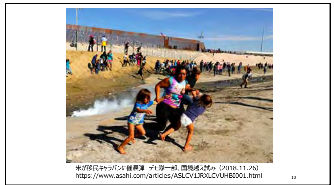
米が移民キャラバンに催涙弾 デモ隊一部、国境越え試み (2018.11.26) https://www.asahi.com/articles/ASLVCV1JRXLCVUHB1001.html